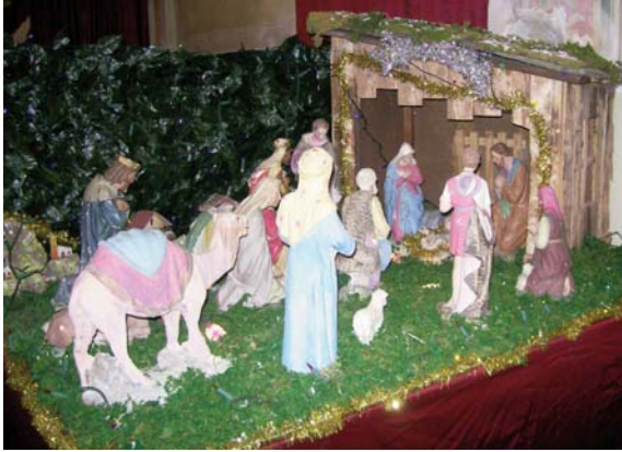
Il presepio della Chiesa di Madonna delle Grazie.