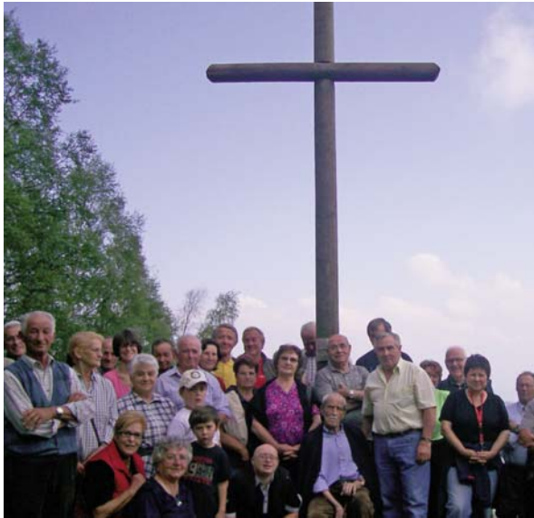
La Croce di Punta Bonetto.

nome gentilizio Roscius, addossato alle mura di un primitivo fortilizio posto a guardia del passaggio tra il saluzzese e la piana di Villar san Costanzo, era nata e consolidata la prima comunità di credenti ed era stata eretta la prima cappella per consentire al sacerdote e al crescente numero di convertiti l'esercizio delle funzioni religiose. Di grande aiuto al prete locale, (chiamato in seguito rettore, parroco, prevosto) fu la collaborazione data