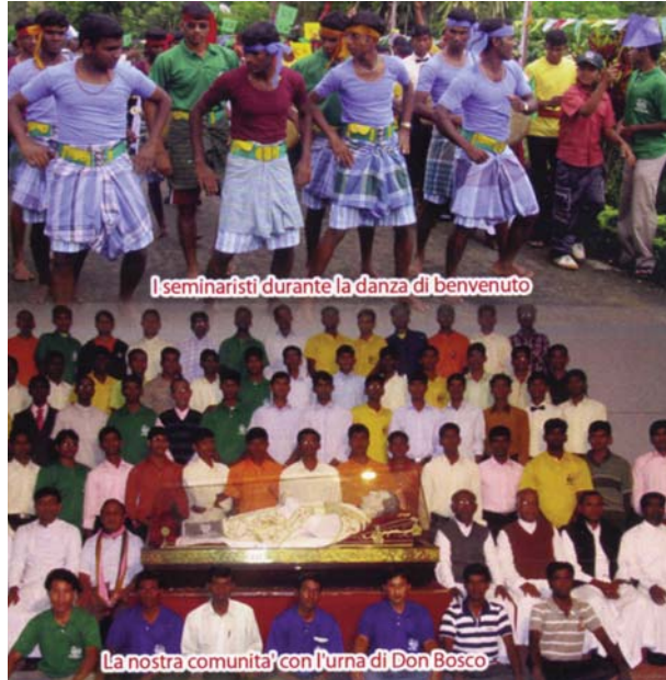
I seminaristi durante la danza di benvenuto

Infine un pensierino per il Natale: il Dio che diviene povero bambino nella mangiatoia ci lascia un esempio di vita vissuta in umiltà, semplicità e in unione con la natura! Impariamo ciò alla scuola di Gesù. Ringraziandovi e promettendovi un ricordo questo Natale, Vi auguro Buon Natale e Felice Anno Nuovo.