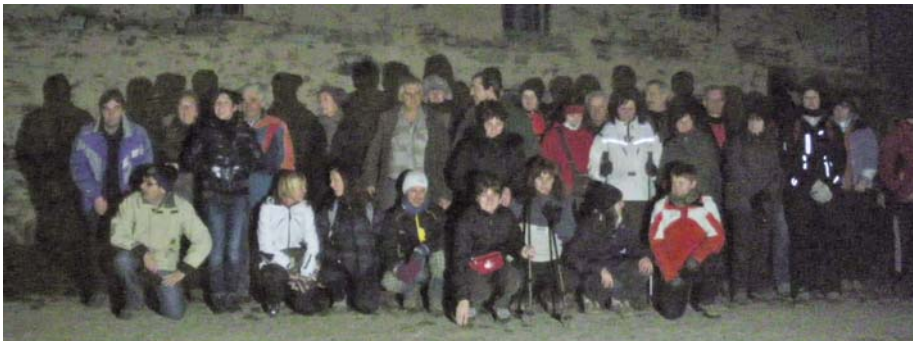
Camminata notturna a Peralba.

Il 7 gennaio, sotto la luna piena e un fantastico cielo stellato, una cinquantina di sportivi hanno trascorso una serata nei sentieri tra Lemma, Peralba e San Bernardo. Tra torroni e vin brulè non sono mancate belle emozioni alla vista, notturna, sulla pianura cuneese. Anche senza la neve la natura offre occasioni da apprezzare e valorizzare. Non abbiamo pubblicamente pregato, ma rispettare e saper lodare il creato, tutto ci è stato donato gratuitamente...pensare e ringraziare Dio per la serata con poche parole che ti vengono naturali, dopo belle esperienze, non è pregare?