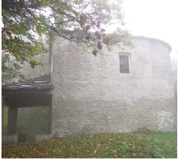
La Cappella di San Bernardo a Lemma.

Accanto al primo nucleo abitativo di origini romane chiamato Roxana o Rosciana, dal