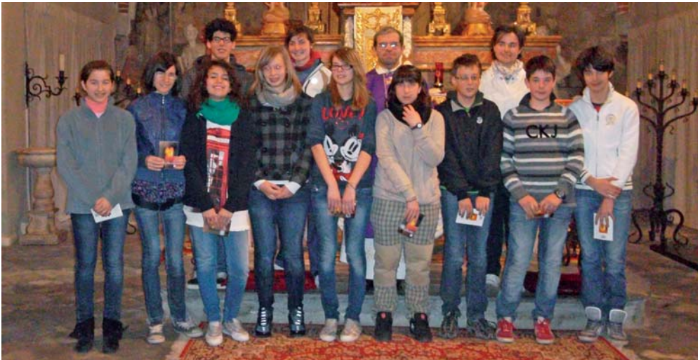
I ragazzi di 2° e 3° media che riceveranno la Cresima il 13 maggio.